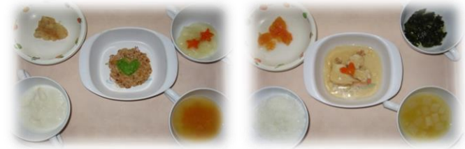
離乳食・中期 (生後7～8か月)